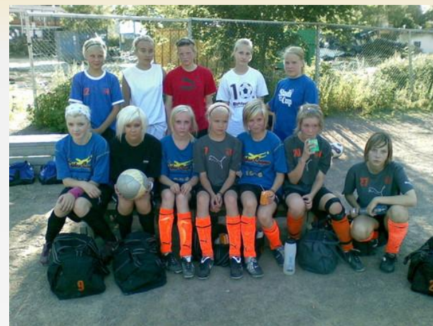
NUVK kykytapahtuma Tikassa 24.7.2008. Kuvassa Tikan ja Fc Kontun tyttöjä